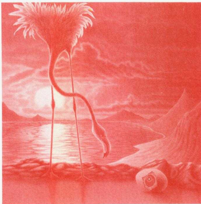
PORTADA: Huevo I, Huevo Cósmico (1976, detalle), por Sheila Rose. Acrílico sobre papel.

© FRENTE DE AFIRMACIÓN HISPANISTA, A. C. Castillo del Morro # 114 Col. Lomas Reforma 11930 México, D. F. Tel. 596-24-26 MÉXICO