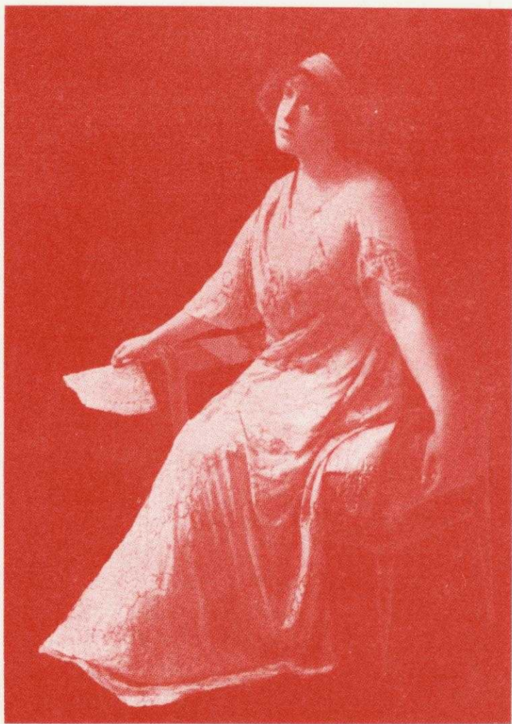
THE LADY OF THE SHALLOWS. BY J. M. W. TURNER. 1845.